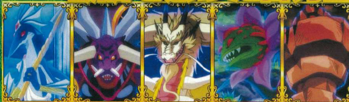
バショウ アースガル 月龍イザヨイ ユグドラシル ローリイ