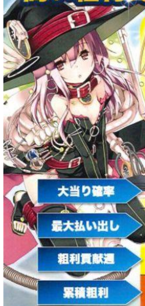
CR遊技性 ミリオンアサー