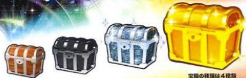
宝箱の種類は4種類