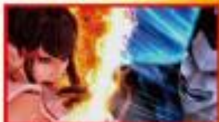
成功すればバトルボーナス確定!