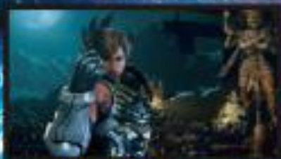
BGMが変化すれば進アップ!