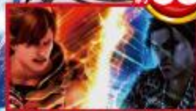
成功すればボーナス確定!