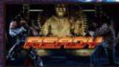
終盤に連続演出発生!