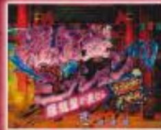
龍籠盤ミッション