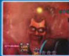
地中からの刺客リーチ