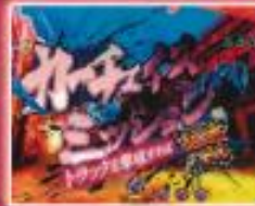
カーチェイスミッション