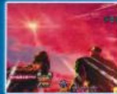
青財大海戦リーチ