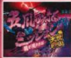
五爪の龍ミッション