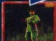
登場キャラで期待度変化