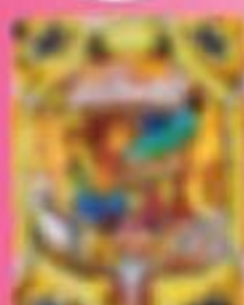
シン●オギア (40週貢献中) ※1