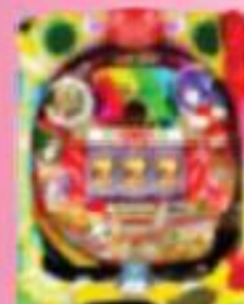
ドラ●麻雀 (12週貢献終了) ※1