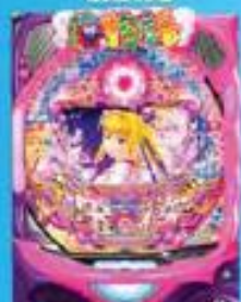
沖縄4桜ライトミドル (47週貢献中) ※1