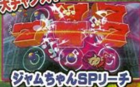
ジャムちゃんSPリーチ