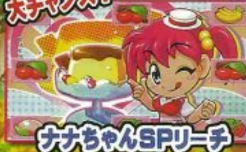
ナナちゃんSPリーチ