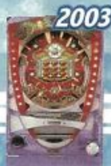
2003 ファイバーワンダーパワーフル