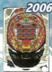
2006 ファイバーパワーフルZERO