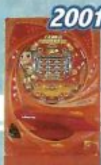
2001 ファイバーワイドパワーフル