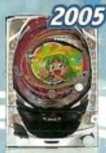
2005 ファイバーネオパワーフル