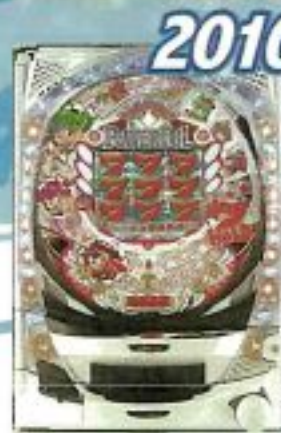
2010 ファイバーパワーフルパレス