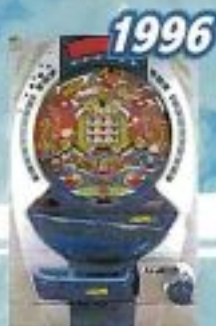
1996 ファイバービッグパワーフル