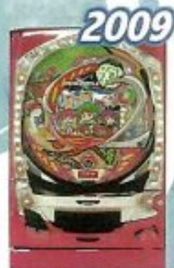
2009 ファイバーパワーフルワールド