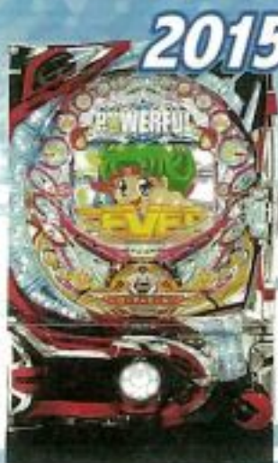
2015 ファイバーパワーフル