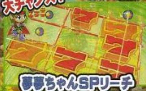
夢夢ちゃんSPリーチ