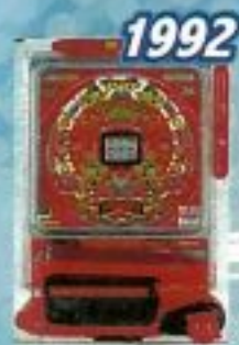
1992 ファイバーパワーフル