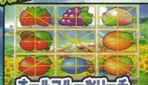
オールフルーツリーチ