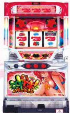
[沖ドキ! パケーション]