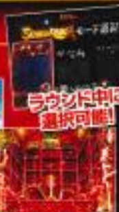
ストーリーモード