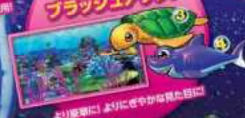
より豪華に! よりにぎやかな見た目に!