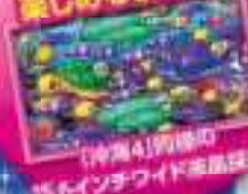
【沖波4】同様の 15.6インチワイド画面採用