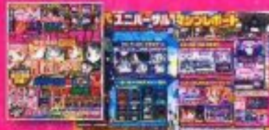
【ユニバーサル完全攻略】