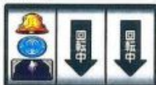
チャンスリプA or 強ベル or その他 (ハズレ/リプレイ/ベル)