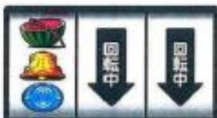
チャンスリプB or スイカ