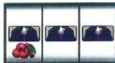
強チェリー (リーチ目)