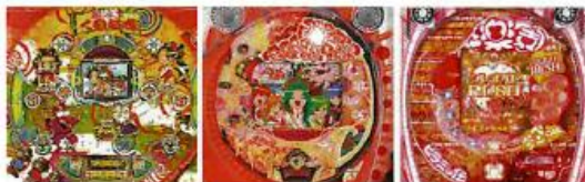
←左から CRくのいち忍法帳 CR新くのいち忍法帳 CRおしおきピラミッド伝 with丸高愛実