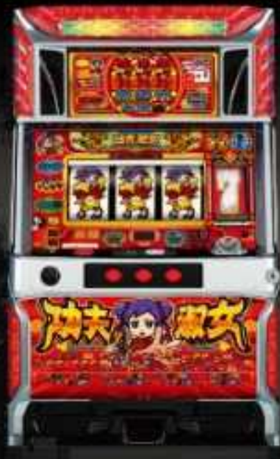
カンフーレディ・テトラ