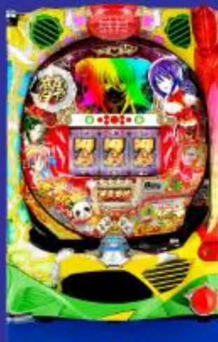
ドラム麻雀物語 (2017年10月)