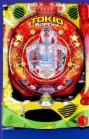
トキオスペシャル (2018年4月)