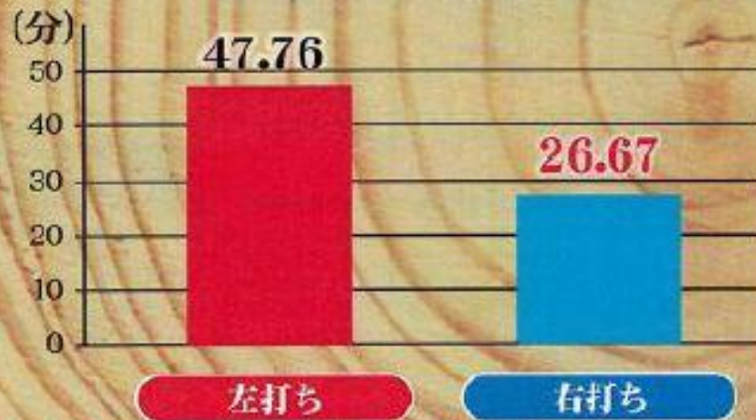
初当りまでの時間

初当りまでの 所要時間 が、 大当り消化時間を含めて 30分! 閉店1時間前でも、 十分勝負出来るスペックです!!