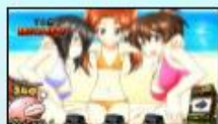
〈みんなでバカンスです!〉