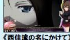
〈西住流の名にかけて〉