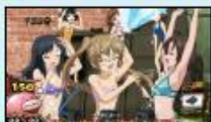
〈戦車を洗濯します!〉