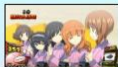
〈今日はエンカイです!〉