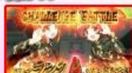
チャレンジバトル発生で 高ランク獲得の大チャンス!