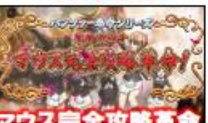
マウス完全攻略革命