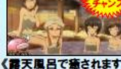
〈露天風呂で癒されます〉