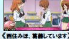
〈西住みほ、葛藤しています〉