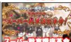
スーパー戦車講座革命