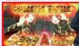
普段は「ちょっと休憩します」なのが、「戦車講座」だと 次回チャレンジバトル発生の大チャンス!