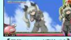
〈仮想アンツィオ高校です〉