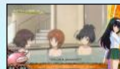
〈あんこうチームを結成します〉