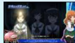
〈沙織さんを捜索します〉