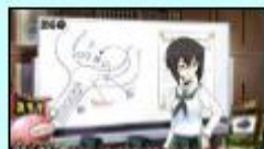
〈作戦会議始めます!〉