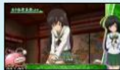
〈五十鈴華、決意します〉