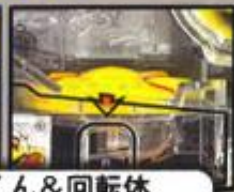
ミニまるくん&回転体