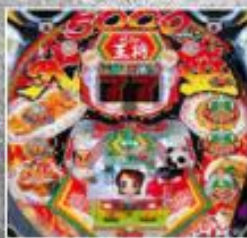
おまけ程度の 引戻し率