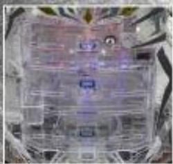
クレーン突破で 大量出玉