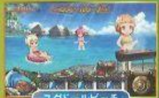
ユグドールビーチ