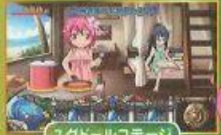
ユグドールコテージ