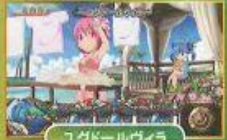
ユグドールヴィラ