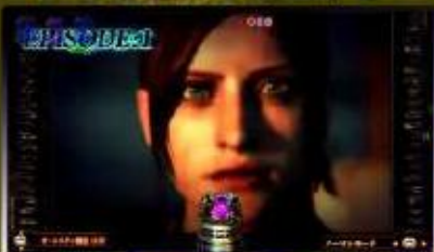
デッドエンドパニック 連続予告