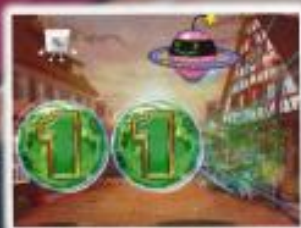
キャラステップアップ