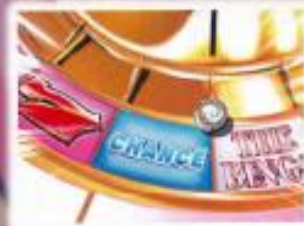
ビンゴルーレット