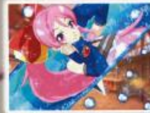
ステップアップフリーズ