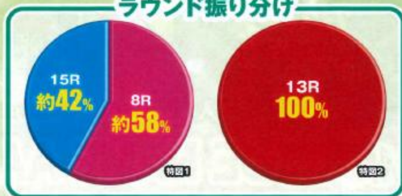
ラウンド振り分け