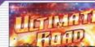
ART確定+50G以上の獲得 +サイコガンダムデストロイ!?