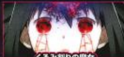
くるみ割りの魔女