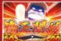
画面変化でチャンスに見える化