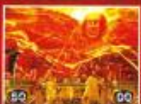
画面変化でチャンスに見える化