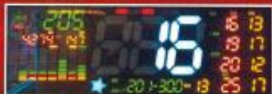
データカウンターを見る