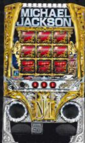
パチスロ マイケル・ジャクソンA