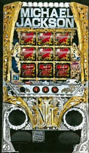
パチスロ マイケル・ジャクソンA