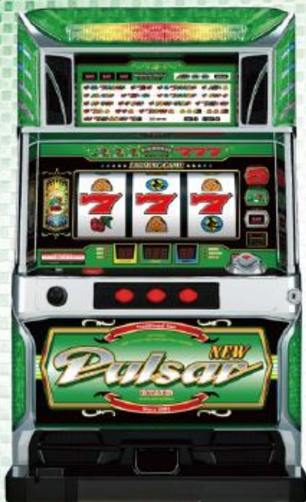
ニューパルサーDX ～チェリーバージョン～