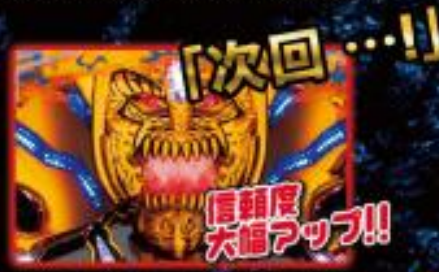
信頼度 大幅アップ!!