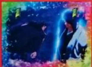
天竺撃破で大当り!