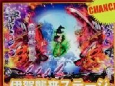
伊賀襲来ステージ