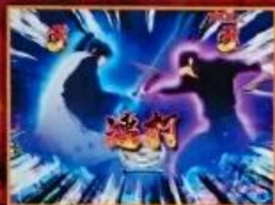
攻撃パターンが一撃ならチャンス!