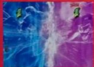
図柄テンパイで天竺とバトル発生