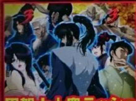
甲賀十人衆ラッシュ