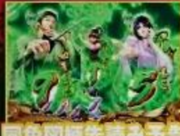
同色図柄先読み予告