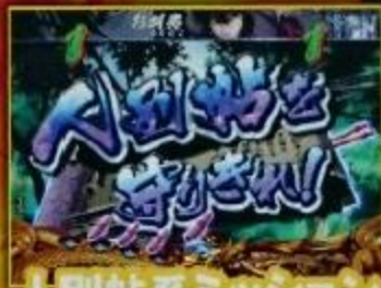
人別帖系ミッション