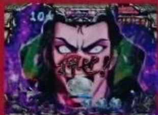
ボタンを押して大当りを勝ち取れ!