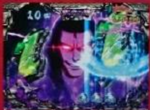
リーチが掛かるとチャンス!