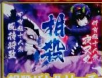
相殺バトルリーチ