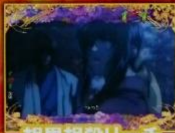
相思相殺リーチ (夢幻泡影)