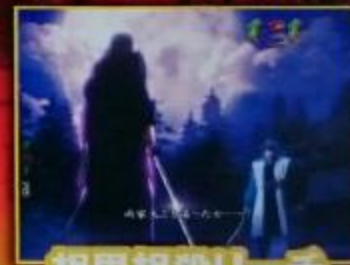
相思相殺リーチ (鬼哭嗷々)