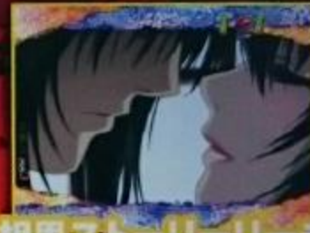
相思ストーリーリーチ