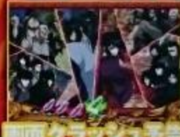
画面クラッシュ予告