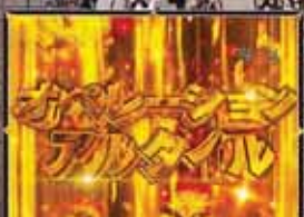
オペレーショナルタイトルリーチ