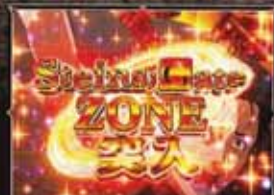
シュタインズ・ゲートZONEゼロ