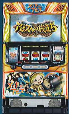
SメイドインアビスEN