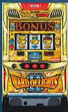
SワードオブライツII WF