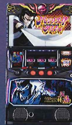
Lバジリスク絆2天膳ZN