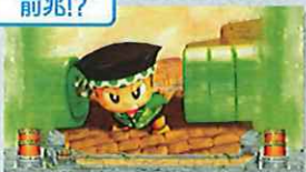
カラダクタエール遺跡