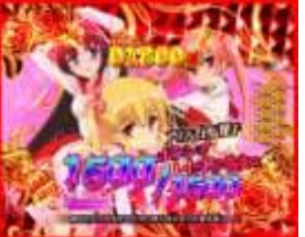
アリア&白雪&理子モード