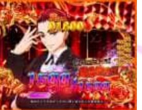
シーロックモード