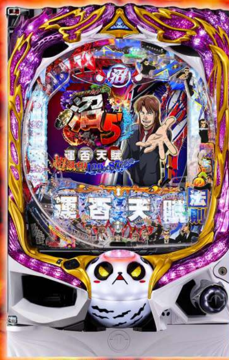
P弾球黙示録カイジ沼5 超欲望129×87%Ver.