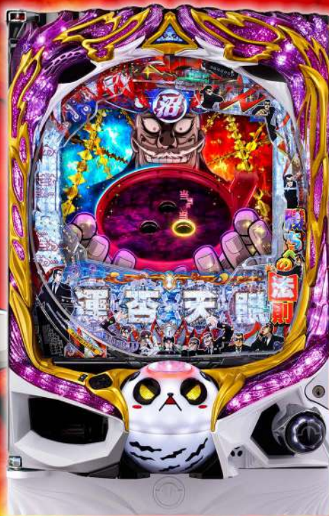
P弾球黙示録カイジ沼5