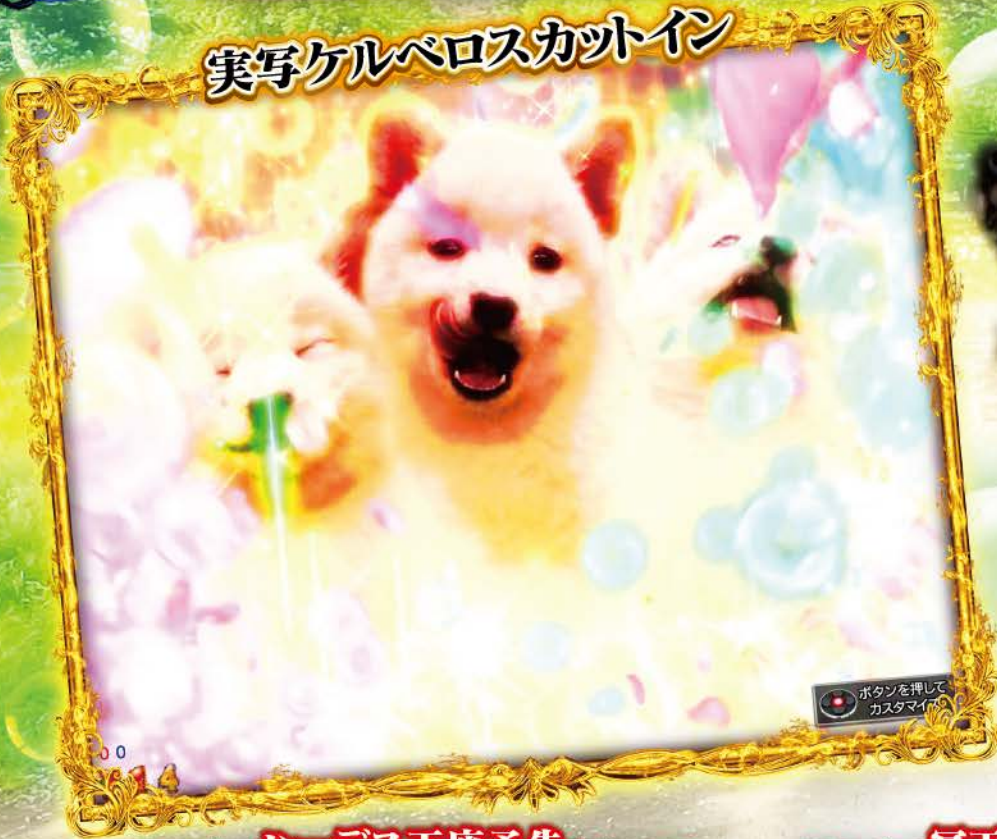
実写ケルペロスカットイン