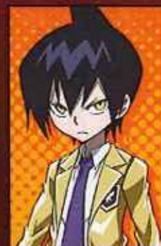
あらい 蓮 道 蓮 CV:朴 璐美