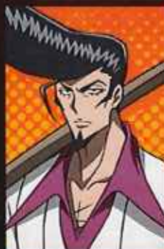
あかみち けん 梅宮 竜之介 CV:田中正彦