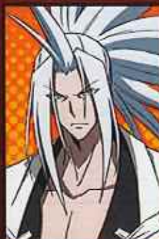
あんに 弥 阿弥陀丸 CV:小西克幸