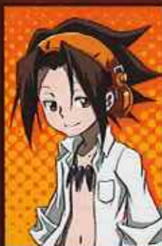
あしは 葉 麻倉 葉 CV:日笠陽子