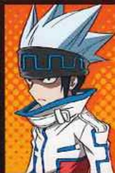
ほろほろ ホロホロ CV:うえだゆうじ