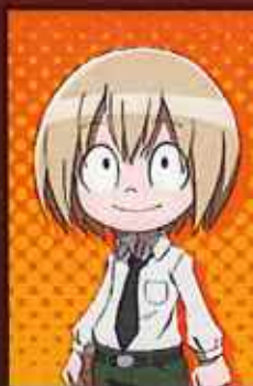
あやと まんじ 小山田 まん太 CV:犬山イヌコ