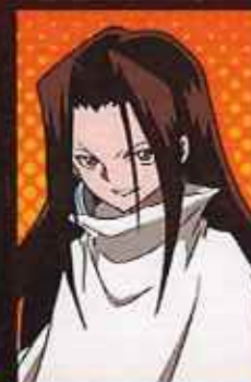
はお ハオ CV:高山みなみ