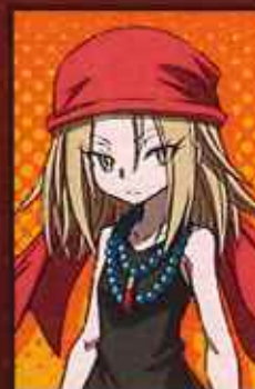
あんな 天 恐山 アンナ CV:林原めぐみ