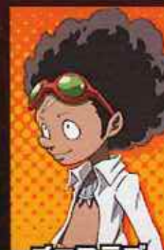
ちよこらぶ まぐだね チョコラブ・ マグダネル CV:くまいもとこ