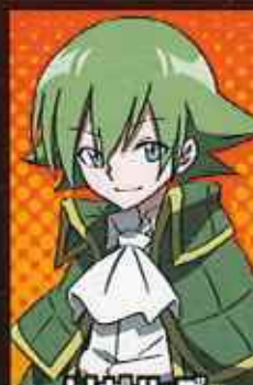
りせるぐ だいせ リゼルグ・ ダイゼル CV:沢海陽子