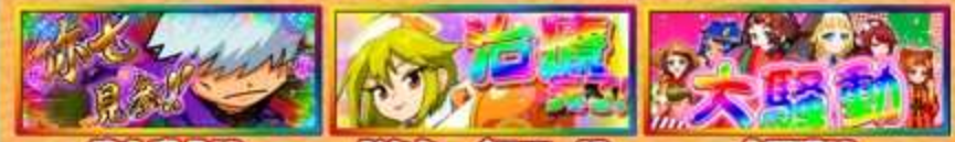
強七乱入!? ドクターイエロー!? 大騒動!?