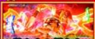
助さん & 格さん