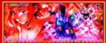
お銀 & 弥七