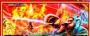
黄門ちゃま & 八兵衛