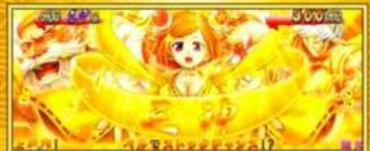
黄門ちゃま & お銀 & 弥七