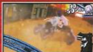
停止で高ダメージ!?