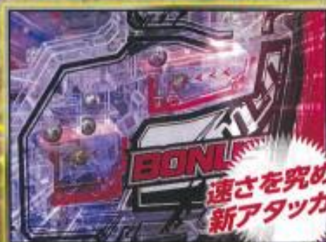
ドリフトアタッカー