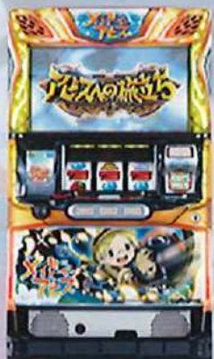
S×イドインアビス E N