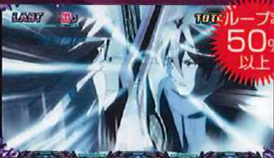
ゲーム数消化で継続ジャッジへ