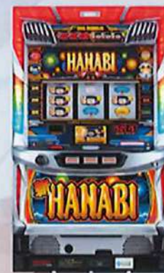
S新ハナビ R H A