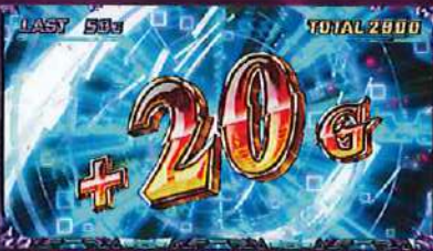
稀役でゲーム数上乘せ