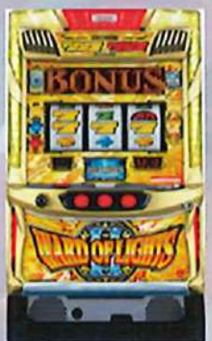
Sソードオブライツ II W F