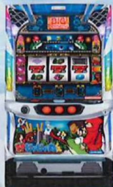
Sジャジャマル H A