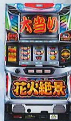
Sハナビゼッケイ B H