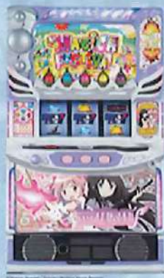
L前後編 F U U